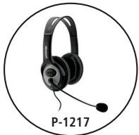
P-1217 Auriculares del operador