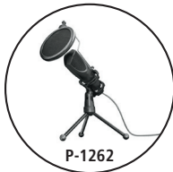
P-1262 Micrófono de retroalimentación